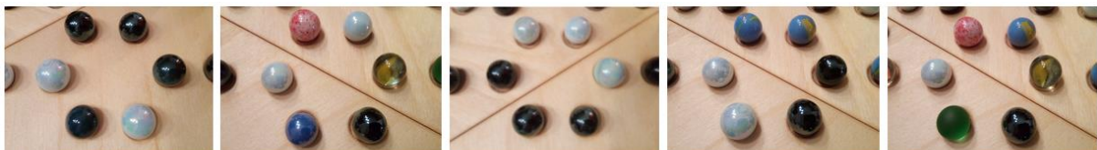
Dieses Sechseck zählt 1 Punkt , da nur ein/e Spieler/-in die meisten Murmeln platziert hat. Dieses Sechseck zählt 1 Punkt , da nur ein/e Spieler/-innen die meisten Murmeln platziert hat. Dieses Sechseck zählt 2 Punkte , da zwei Spieler/-innen gleich viele Murmeln platziert haben. Dieses Sechseck zählt 3 Punkte , da drei Spieler/-innen gleich viele Murmeln platziert haben. Dieses Sechseck zählt 6 Punkte , da sechs Spieler/-innen gleich viele Murmeln platziert haben.

Am Ende des Spieles werden alle Sechsecke ausgezählt. Jedes Sechseck erhält so viele Punkte zugeordnet, wie die Anzahl der Spieler mit den meisten Murmeln im Sechseck.